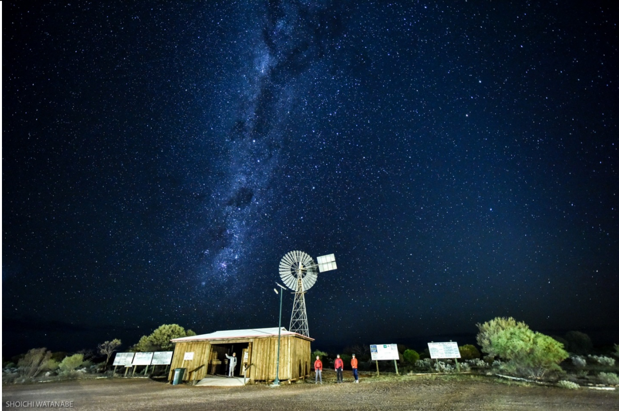
上左 ゴールドコーストの荒波 上右 オーシャンロードの日の出 中左 ノーザンテリトリーの砂漠の夕暮れ 中右 ケアンズの遠浅の海 下 砂漠の寒村の夜空